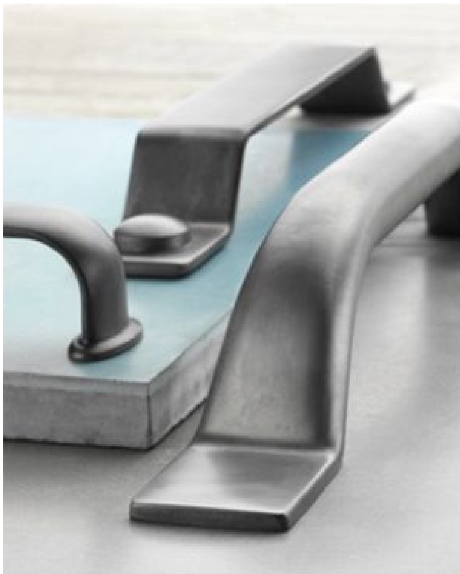
Эффект брашированного железа