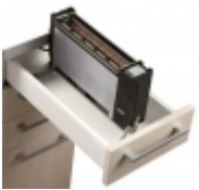
D'Ñ•Ñ,Ñ€D°D z D²D°D μ D¼Ñ•D¹ Ñ, D¾Ñ•Ñ, D μ Ñ€ ritter ET 10 16 518 Ñ€ÑfD±

DYD¾Ñ•Ñ, D°D²D»Ñ•D μ Ñ,Ñ•Ñ• D z D¾D' D·D°D°D°D°. D•Ñ€Ñ, .545 000 D'D»Ñ• D¼D¾D½Ñ, D°D¶D° D² Ñ•Ñ%°D z D° Ñ'D z Ñ€D z D½D¾D¹ D¾Ñ, 30 Ñ•D¼. D'D»ÑfD±D z D½D° - 385 D¼D¼, Ñ'D z Ñ€D μ D½D° â€“ 195 D¼D¼, D²Ñ•Ñ•D¾Ñ, D° â€“ 79 D¼D¼. DYÑ€D¾D'ÑfD°Ñ, D'D»Ñ• D½D°Ñ€D μ D·D°D z D'D²D z D¾D°D μ Ñ,Ñ•Ñ• Ñ•D z Ñ€D°D²D° D¾Ñ, D½D¾D¶D° DœD μ Ñ, D°D»D»D z Ñ†D μ Ñ•D°D z D¹ D°D¾Ñ€D z ÑfÑ• D'D¾D»D½D z Ñ•Ñ,Ñ•D¹ D·D°D°D°D»D μ D½D½Ñ•D¹ D½D¾D¶ 17 Ñ•D¼ D² D'D z D°D¼D μ Ñ,Ñ€D μ [DYD¾D'Ñ€D¾D±D½D μ Dμ...]