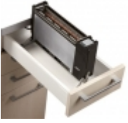
D'N·N, N \in D^{\circ}D_{\zeta}D^2D^{\circ}D_{\mu}D^{\frac{1}{4}}N \cdot D^1 N, D^{\frac{3}{4}}N \cdot N, D_{\mu}N \in Ritter ET 10 16 937 N \in Nf D_{\pm}

D·NĚN, .545 000 D"»N· D¼D¾D½N, D°D¶D° D² N·N% D_{\zeta}D^{\circ} N'D, N \in D_{\zeta}D^{\frac{1}{2}}D^{\frac{3}{4}}D^1 D^{\frac{3}{4}}N, 30 N \cdot D^{\frac{1}{4}}. D"»Nf D_{\pm}D_{\zeta}D^{\frac{1}{2}}D^{\circ} - 385 D^{\frac{1}{4}}D^{\frac{1}{4}}, N'D, N \in D_{\mu}D^{\frac{1}{2}}D^{\circ} \hat{a} \in 195 D^{\frac{1}{4}}D^{\frac{1}{4}}, D²N \cdot N \cdot D^{\frac{3}{4}}N, D^{\circ} \hat{a} \in 79 D^{\frac{1}{4}}D^{\frac{1}{4}}. DÝN \in D^{\frac{3}{4}}D'Nf D^{\circ}N, D'D \gg N \cdot D^{\frac{1}{2}}D^{\circ}N \in D_{\mu}D \cdot D^{\circ}D_{\zeta} D'D²D, D³D^{\circ}D_{\mu}N, N \cdot N \cdot N \cdot D_{\zeta}N \in D^{\circ}D^2D^{\circ} D^{\frac{3}{4}}N, D^{\frac{1}{2}}D^{\frac{3}{4}}D¶D^{\circ} D_{\infty}D_{\mu}N, D^{\circ}D \gg D_{\zeta}N \dagger D_{\mu}N \cdot D^{\circ}D_{\zeta}D^1 D^{\circ}D^{\frac{3}{4}}N \in D_{\zeta}Nf N \cdot D'D^{\frac{3}{4}}D \gg D^{\frac{1}{2}}D_{\zeta}N, N \cdot N, N \cdot D^1 D \cdot D^{\circ}D^{\circ}D^{\circ}D \gg D_{\mu}D^{\frac{1}{2}}D^{\frac{1}{2}}N \cdot D^1 D^{\frac{1}{2}}D^{\frac{3}{4}}D¶ 17 N \cdot D^{\frac{1}{4}} D^2 D'D_{\zeta}D^{\circ}D^{\frac{1}{4}}D_{\mu}N, N \in D_{\mu} [DÝD¾D'N \in D¾D_{\pm}D½D_{\mu}D_{\mu}...]