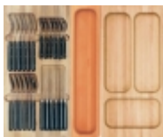
DšD³/4D¹/4D¿D»DµD°N, Essetre Gourmet-line N•D³/4 N•N,D³/4D»D³/4D²N•D¹/4D¿ D¿N€D¿D±D³/4N€D°D¹/4D¿ D±D°D•D° 600 D¹/4D¹/4 27 900 N€NfD±

D•D°D»D¿N±D¿Dµ D¿N€D°D°N,D¿N±DµN•D°D¿ D²N•DµD³D³/4 D°N•N•D³/4N€N,D¿D¹/4DµD¹/²N,D° D²N•D¿NfN•D°D°DµD¹/4D³/4D¹ D¿N€D³/4D¹NfD°N±D¿D¿ D¹/²D° N•D°D»D°D¹Dµ N,,D°D±N€D¿D°D, Essetre D³D°N€D°D¹/²N,D¿N€NfDµN, D°D»D¿DµD¹/²N,D°D¹/4 D¹/4D¿D¹/²D¿D¹/4D°D»NCE¹/²D³/4Dµ D²N€DµD¹/4N• D¿D³/4D»NfN±DµD¹/²D¿N• D•D°D°D°D•D°, D° D²D°D°NfNfD¹/4D¹/²D°N• NfD¿D°D°D³/4D²D°D°, N€D°D•N€D³/4D±D³/4N,D°D¹/²D¹/²D°N• N,,D°D±N€D¿D°D³/4D¹ Essetre N•D¿DµN±D¿D°D»NCE¹/²D³/4 D¹D»N• N•D²D³/4DµD¹ D¿N€D³/4D¹NfD°N±D¿D¿, D³D°N€D°D¹/²N,D¿N€NfDµN, N•D³/4N...N€D°D¹/²D¹/²D³/4N•N,NCE N,D³/4D²D°N€D° D¿N€D¿ N,N€D°N•D¿D³/4N€N,D¿N€D³/4D²D°Dµ.