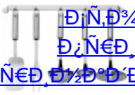
ESSETRE 1/2 N, 3/4 N, 1 N