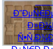
ESSETRE 1/2 N, 3/4 N, 1 N