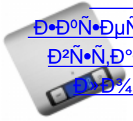
ESSETRE 1/2 N, 3/4 N, 1 N