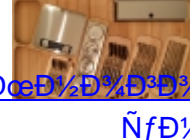
ESSETRE 1/2 N, 3/4 N, 1 N