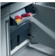
Hailo Deposito Գլխավոր Գլխավոր Գլխավոր Գլխավոր Գլխավոր 60Նիւթեր. 3280-60 4 531 Նիւթեր

Գլխավոր Գլխավոր Գլխավոր Գլխավոր Գլխավոր Գլխավոր Գլխավոր Գլխավոր Գլխավոր Գլխավոր Գլխավոր Գլխավոր Գլխավոր Գլխավոր Գլխավոր Գլխավոր Գլխավոր Գլխավոր Գլխավոր Գլխավոր Գլխավոր Գլխավոր Գլխավոր Գլխավոր Գլխավոր Գլխավոր Գլխավոր Գլխավոր Գլխավոր Գլխավոր [Գլխավոր Գլխավոր Գլխավոր...]