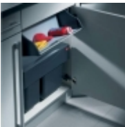
Hailo Deposito Գլխավոր Գլխավոր Գլխավոր Գլխավոր Գլխավոր 50Նիւթեր. 3280-50 4 464 Նիւթեր

Գլխավոր Գլխավոր Գլխավոր Նկարագրեր Գլխավոր Նիւթեր Կարգաւորիչ Գլխավոր Նկարագրեր HAILO Laundry-Carrier Գլխավոր Նիւթեր, 600Գլխավոր. Գլխավոր Գլխավոր Գլխավոր Գլխավոր Գլխավոր Գլխավոր Գլխավոր Գլխավոր Գլխավոր Գլխավոր Գլխավոր Գլխավոր Գլխավոր Գլխավոր Գլխավոր Գլխավոր Գլխավոր Գլխավոր Գլխավոր Գլխավոր Գլխավոր Գլխավոր Գլխավոր Գլխավոր Գլխավոր + 2 Գլխավոր Գլխավոր Գլխավոր Գլխավոր 33 Գլխավոր Գլխավոր + Գլխավոր Գլխավոր 12 Գլխավոր Գլխավոր Գլխավոր Գլխավոր Գլխավոր 2,5 Գլխավոր Գլխավոր [Գլխավոր Գլխավոր Գլխավոր...]