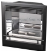
ӘҘӘ¼Ә;Ә°Ә° Ә´Ә»Ң• Ә±Ә, Ә³Ә°Ә°Ә¼Ә, Ә½Ә¼Ә² Premi Standart Ә•F-07 60 000 ҢЄҢғӘ±

ӘҮӘ¼ҢЄҢ, Ә°Ә» Ә¼Ә°Ң•Ң•Ә, Ә² Ә±ӘµҢЄҢ`Ә-Ң«. Ә;Ә²ӘµҢ, Ә;Ә¼ Ә¶Әµ»Ә°Ә½Ә, ҢҢҢӘ´Ә¼Ә-Ә¼Ә³Ә¶Ә¶Ә½Ә¼Ң•Ң, ҢСӘ Ә, Ә-Ә¼ӘµӘ½Ә, Ң, ҢСӘ ҢЄӘ°Ә-Ә¼ӘµҢЄҢ« Ә;Ә¼Ә´ Ә´Ә°Ң` Ә, Ә½Ң, ӘµҢЄҢСӘӘµҢЄ! ӘҮҢЄӘ¼Ң•Ң, Ә°Ң• Ң, Ә¼ҢЄӘ¼Ә° Ә, Ә´ӘµӘ°Ә»ҢСӘӘ½Ә° Ә´Ә»Ң• Ә¼Ә°Ә»ӘµӘ½ҢСӘӘ°Ә, Ң... Ә°Ә²Ә°ҢЄҢ, Ә, ҢЄ Ә´Ә°Ә±Ә°ҢЄӘ, Ң, Ң« : Ң`Ә, ҢЄӘ, Ә½Ә°: 860 Ә¼Ә¼ Ә²Ң«Ң•Ә¼Ң, Ә°: 860 Ә¼Ә¼ Ә³Ә»ҢғӘ±Ә, Ә½Ә°: 400 Ә¼Ә¼ [ӘҮӘ¼Ә´ҢЄӘ¼Ә±Ә½ӘµӘµ...]