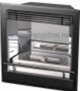
Этот прибор имеет мощность 60 000 Вт. Модель Premi Standart

При эксплуатации прибора необходимо соблюдать все правила техники безопасности. В случае возникновения неисправности рекомендуется обратиться к специалистам. При выборе прибора необходимо учитывать его мощность, которая должна быть равна или превышать суммарную мощность обогреваемых помещений.