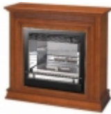
Этот прибор предназначен для использования в качестве основной или дополнительной единицы в составе системы отопления. Этот прибор имеет мощность 97 500 Вт. Модель Standart

При эксплуатации прибора необходимо соблюдать все правила техники безопасности. В случае возникновения неисправности рекомендуется обратиться к специалистам. При выборе прибора необходимо учитывать его мощность, которая должна быть равна или превышать суммарную мощность обогреваемых помещений.