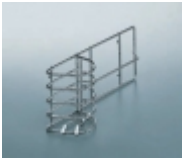
Đ”ĐµÑ€Đ¶Đ°Ñ,ĐµĐ»Ñ€ Đ´Đ»Ñ• Ñ•Đ¾Đ²Đ°Đ° Đ, Ñ%ĐµÑ,Đ°Đ, KESSEBOHMER 2 094 Ñ€ÑƒĐ±

Đ•Ñ€Ñ, . 00 2010 0005 Đ;ĐµÑ,Đ°Đ° Đ½Đ°Đ²ĐµÑ•Đ½Đ°Ñ•, 300Ñ...200Ñ...72 Đ¼Đ¼, Đ”Đ»Ñ• Đ°Ñ€Ñ,..: 002000 [ĐŸĐ¾Đ´Ñ€Đ¾Đ±Đ½ĐµĐµ...]