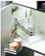
ĐšĐ¾Ñ€Đ·Đ,Đ½Đ° Đ¿Đ¾Đ²Đ¾Ñ€Đ¾Ñ,Đ½Đ°Ñ• KESSEBĐŽHMER 1 939 Ñ€ÑƒĐ±

Đ•Ñ€Ñ.,00 1170 0005 Đ—ĐµÑ€Đ°Đ»Đ¾ Đ°Đ¾Ñ•Đ¼ĐµÑ,Đ,Ñ†ĐµÑ•Đ°Đ¾Đµ ĐšÑ€ĐµĐ¿Đ,Ñ,Ñ•Ñ• Đ° Ñ•Ñ,ĐµĐ½Đµ, Đ´Đ,Đ°Đ¼ĐµÑ,Ñ€ 190 Đ¼Đ¼ ĐžÑ,Đ´ĐµĐ»Đ°Đ° Ñ...Ñ€Đ¾Đ¼ Đ³Đ»Ñ•Đ½ĐµÑ† [ĐŸĐ¾Đ´Ñ€Đ¾Đ±Đ½ĐµĐµ...]