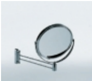
Kessebohrer Đ·ĐµÑ€Đ°Đ»Đ¾ Đ°Đ¾Ñ•Đ¼ĐµÑ,Đ,Ñ†ĐµÑ•Đ°Đ¾Đµ 10 237 Ñ€ÑƒĐ±

Đ"Đ°Đ½Đ½Ñ«Đ¹ Ñ€Đ°Đ·Đ´ĐµĐ» Đ½Đ°Ñ...Đ¾Đ´Đ,Ñ,Ñ•Ñ• Đ² Ñ€Đ°Đ·Ñ€Đ°Đ±Đ¾Ñ,Đ°Đµ. ĐŸĐ¾ Đ²Đ¾Đ¿Ñ€Đ¾Ñ•Đ°Đ¼ Đ¿Ñ€Đ,Đ¾Đ±Ñ€ĐµÑ,ĐµĐ½Đ,Ñ• Đ, Đ°Đ¾Đ½Ñ•ÑƒĐ»Ñ€Ñ,Đ°Ñ†Đ,Đ, Đ¿Đ¾ Đ¿Ñ€Đ¾Đ´ÑƒĐ°Ñ†Đ,Đ Kessebohrer Đ¾Đ±Ñ€Đ°Ñ%Đ°Đ¹Ñ,ĐµÑ•Ñ€Đ° Đ° Đ½Đ°Ñ´Đ,Đ¼ Đ¼ĐµĐ½ĐµĐ´Đ¶ĐµÑ€Đ°Đ¼ Đ¿Đ¾ Ñ,ĐµĐ»ĐµÑ,,Đ¾Đ½Ñƒ Đ»Đ,Đ±Đ¾ Ñ†ĐµÑ€ĐµĐ· Ñ,,Đ¾Ñ€Đ¼Ñƒ Đ¾Đ±Ñ€Đ°Ñ,Đ½Đ¾Đ¹ Ñ•Đ²Ñ•Đ·Đ. ĐŸĐ¾Đ»Đ½Ñ·Đ¹ Đ°Ñ•Ñ•Đ¾Ñ€Ñ,Đ,Đ¼ĐµĐ½Ñ, Đ, Ñ†ĐµĐ½Ñ·Đ½Đ° Đ¿Ñ€Đ¾Đ´ÑƒĐ°Ñ†Đ,ÑŽ Kessebohrer Đ¼Đ¾Đ¶Đ½Đ¾ Đ¿Đ¾Ñ•Đ¼Đ¾Ñ,Ñ€ĐµÑ,Ñ€Đ² Ñ€Đ°Đ·Đ´ĐµĐ»Đµ "ĐŸÑ€Đ°Đ¹Ñ•Ñ".