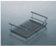
ĐšĐ¾Ñ€Đ·Đ, Đ½Đ° Đ½Đ°Đ²ĐµÑ•Đ½Đ°Ñ• 300 Đ¼Đ¼ KESSEBOHMER 1 784 Ñ€ÑƒĐ±

Đ•Ñ€Ñ, . 00 2010 0005 Đ;ĐµÑ,Đ°Đ° Đ½Đ°Đ²ĐµÑ•Đ½Đ°Ñ•, 300Ñ...200Ñ...72 Đ¼Đ¼, Đ”Đ»Ñ• Đ°Ñ€Ñ,..: 002000 [ĐŸĐ¾Đ´Ñ€Đ¾Đ±Đ½ĐµĐµ...]