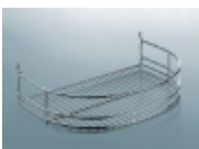
Đ;ĐµÑ,Đ°Đ° Đ¿Đ¾Đ»ÑƒĐ°Ñ€ÑƒĐ³Đ»Đ°Ñ• D 320 Đ¼Đ¼ Kessebohmer 3 257 Ñ€ÑƒĐ±

Đ•Ñ€Ñ,.00 4971 0005 Đ Đ°Đ·Đ¼ĐµÑ€ 333Ñ...537Ñ...50 Đ¼Đ¼ [ĐŸĐ¾Đ´Ñ€Đ¾Đ±Đ½ĐµĐµ...]