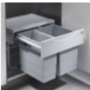
D´Ñ·D´D²D, D¶D½D°Ñ·Dµ D¼ÑfÑ•D¾Ñ€D½D°Ñ·Dµ D²DµD´Ñ€D° Hailo Tandem Space Saving 3644-70 13 932 Ñ€ÑfD±

D´Ñ·D´D²D, D¶D½D°Ñ• D¼ÑfÑ•D¾Ñ€D½D°Ñ• Ñ•D, Ñ•Ñ, DµD¼D° D² Ñ€D°Ñ·D¿D½D¾D¹ Ñ´D°D°Ñ,, D¿D¾D´ D¼D¾D¹D°Ñf Ñ• 2 - D¼Ñ• D²DµD´Ñ€D°D¼D, D¿D¾ 18 D»D, Ñ, Ñ€D¾D² D´D»Ñ• ÑfÑ•Ñ, D°D½D¾D²D°D, D¿D¾D´ D¼D¾D¹D°Ñf D² Ñ´D°D°Ñ,, Ñ·D, Ñ€D, D½D¾D¹ D¾Ñ, 400D¼D¼ D´D»ÑfD±D, D½D° â€” 475 D¼D¼, D° D²Ñ·Ñ•D¾Ñ, D° â€” 336D¼D¼. [DŸD¾D´Ñ€D¾D±D½DµDµ...]