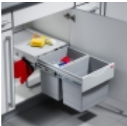
D´Ñ·D´D²D, D¶D½D°Ñ• D¼ÑfÑ•D¾Ñ€D½D°Ñ• Ñ•D, Ñ•Ñ, DµD¼D° Hailo Tandem Space Saving 3641-12 14 138 Ñ€ÑfD±

- DšÑ€Ñ·Ñ´D°D° Ñ,, D, D°Ñ•D, Ñ€ÑfDµÑ, Ñ•Ñ• D° D±D¾D°D¾D²D, D½D°D¼ D°D¾Ñ€D¿ÑfÑ•D° D½D°D´ D²DµD´Ñ€D°D¼D, D, D¼D¾D¶DµÑ, D, Ñ•D¿D¾D»ÑCED·D¾D²D°Ñ, ÑCEÑ•Ñ• D°D°D° D¿D¾D»D¾Ñ‡D°D° D´D»Ñ• Ñ...Ñ€D°D½DµD½D, Ñ• D±Ñ·Ñ, D¾D²D¾D¹ Ñ...D, D¼D, D, D¿Ñ€D¾Ñ‡D, Ñ... D¼DµD»D¾Ñ‡DµD¹