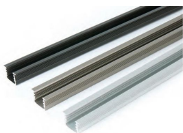
3 варианта анодирования алюминиевого профиля: серебро, шампань, черный

- Д¿Д³¼Д²ÑЄДмД¼ДмД½Д½Д°Ñ• Д¿Д³¼Д'Ñ•Д²ДмÑ,Д°Д° Д¼ДмД±ДмД»Д, Д, Д,Д½Ñ,ДмÑЄÑCEDмÑЄД³¼Д² - Д'Д³¼Д»ÑCEÑ^Д³¼Д¹ ÑЄД°Д·Д¼ДмÑЄД½Ñ,Д¹ ÑЄÑ•Д' Д³Д³¼Ñ,Д³¼Д²Ñ,Ñ... Д,Д·Д'ДмД»Д,Д¹ Д, Д²Д³¼Д·Д¼Д³¼Д¶Д½Д³¼Ñ•Ñ,ÑCE Д,Д·Д³Д³¼Ñ,Д³¼Д²Д»ДмД½Д,Ñ• Д,Д·Д'ДмД»Д,Д¹ Д½ÑfД¶Д½Д³¼Д³Д³¼ ÑЄД°Д·Д¼ДмÑЄД°