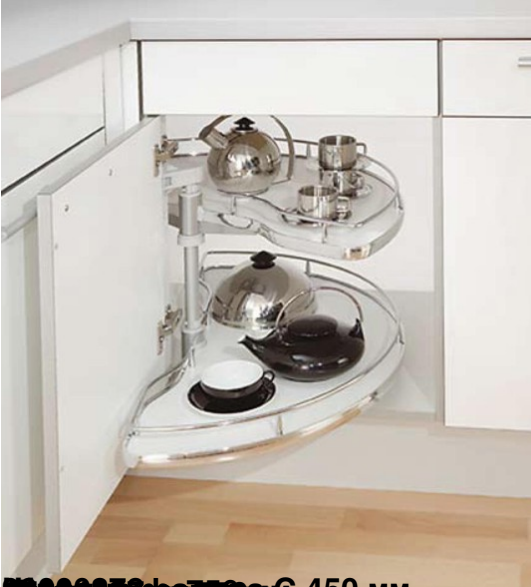
100002053 Артикул А 450 мм, диаметр 450 мм, высота 200 мм, ширина 510 мм, дверца